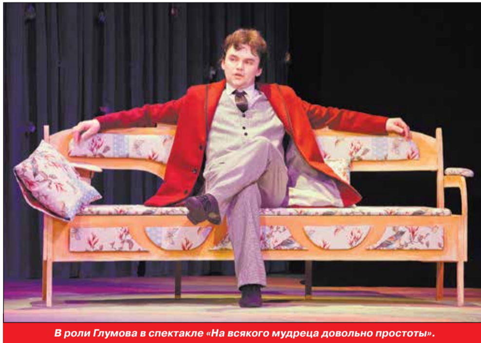
В роли Глумова в спектакле «На всякого мудреца довольно простоты».

В свою очередь все блага цивилизации - магазины, школа, почта - у острова Свободы были на каких-то других берегах. И когда