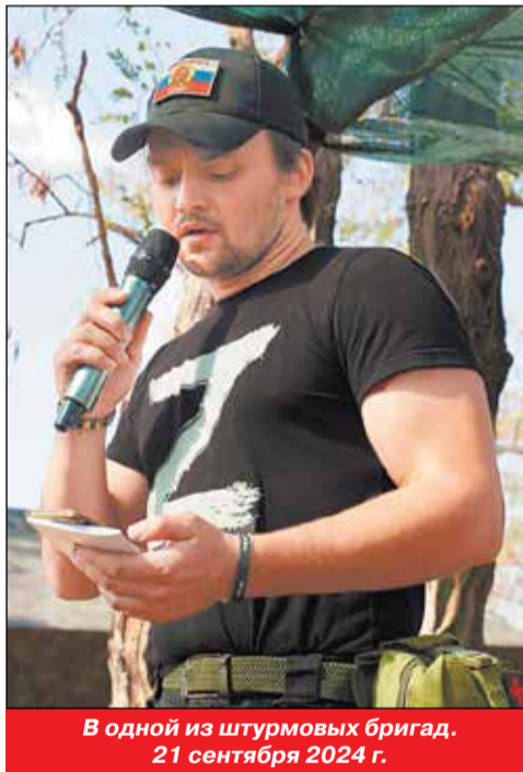
В одной из штурмовых бригад. 21 сентября 2024 г.