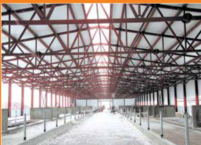
Новая ферма почти готова к запуску.