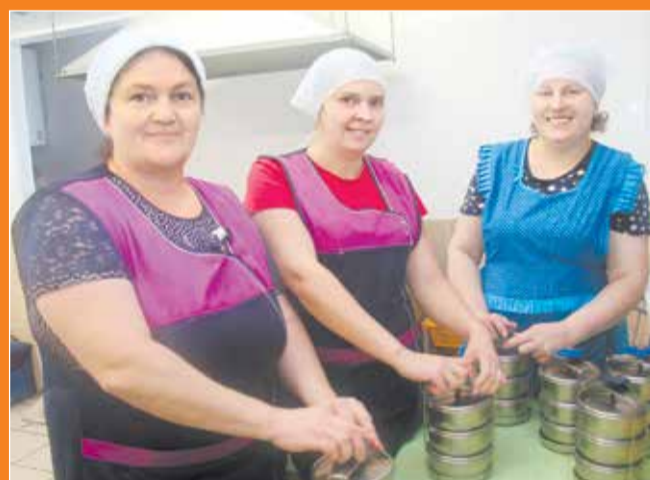
В периоды посевной и уборочной обеды, заботливо приготовленные работницами столовой АО «Азовское», доставляются прямо на поля.