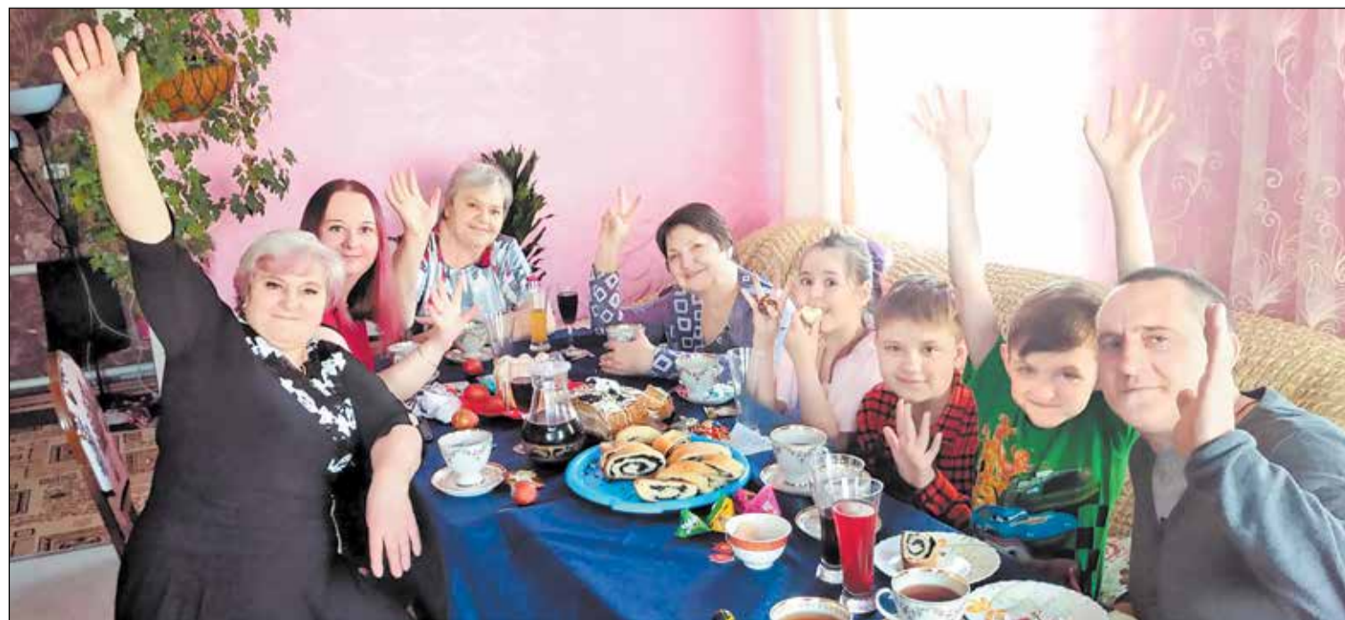
Дружная семья в сборе.

Лев ГРАЧЁВ. Фото из архива семьи Сафроновых.