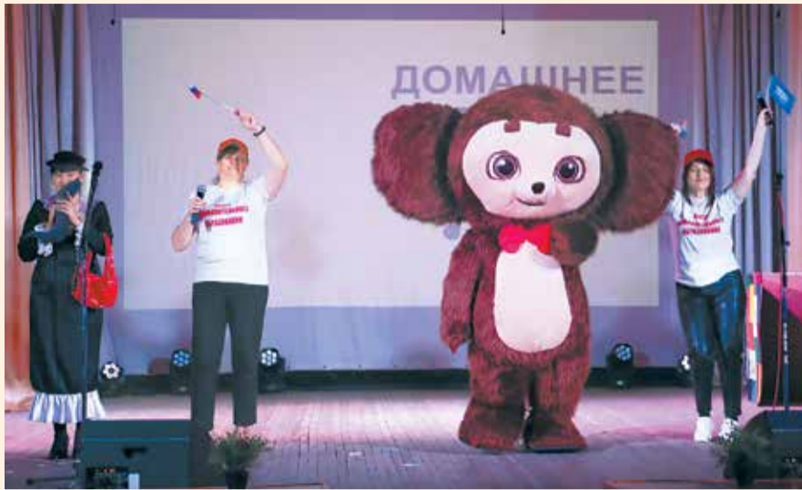
Фрагмент «Домашнего задания» Центра дополнительного образования Любинского района.

Координационный совет организаций профсоюзов в Любинском муниципальном районе не первый год является организатором конкурсов на лучшую первичку района. На этот раз в канун Дня профсоюзов в Омской области состоялось приуроченное к этой дате «Профсоюзное ранде - ву»