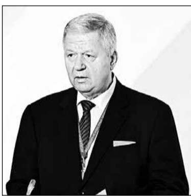
Михаил Шмаков: «Система социального партнерства в нашей стране является наиболее развитой во всем мире».