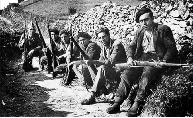
Бастующие шахтеры в провинции Астурия.