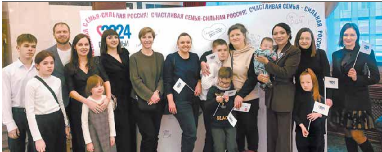
В Омской области торжественное открытие Года семьи состоялось в Концертном зале. Разумеется, в нем участвовали многодетные семьи.