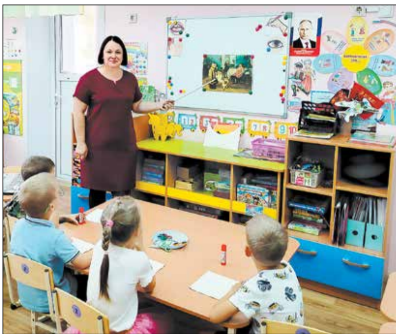
... и уроки безопасности для воспитанников.