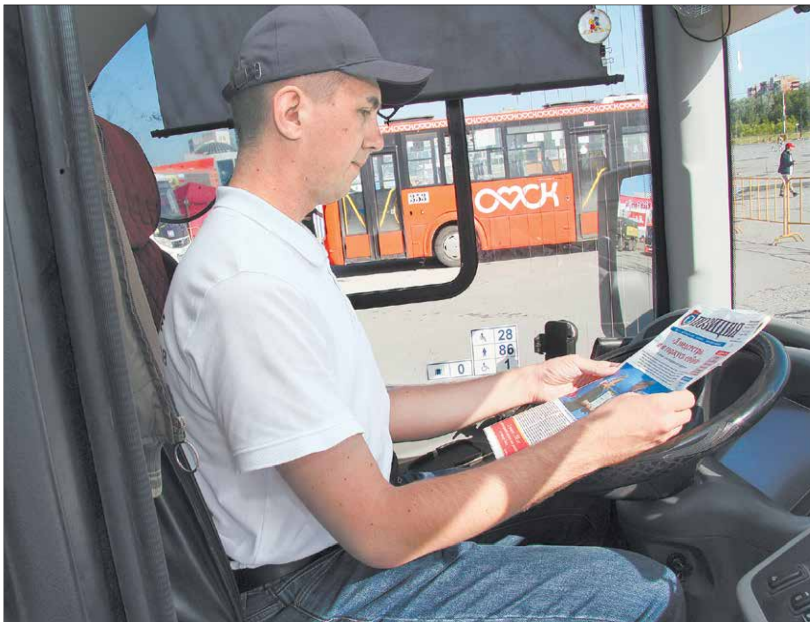
Зачастую между рейсами водители омского пассажирского транспорта уделяют время полезному чтению - в этом им помогает газета «Позиция».

Состоялся конкурс профессионального мастерства водителей городских автобусов