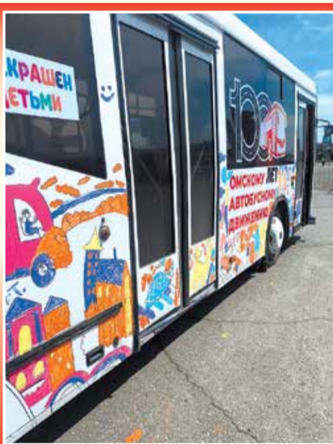
Вот так выглядит дизайн автобуса в исполнении юных художников.

ствую себя уверенно: вожу ПАЗ по маршруту № 21, идущему по Левобережью. Работу свою ценю за стабильность, за ту пользу, которую она позволяет приносить пассажирам, да и зарплата устраивает. Соревнования - это новый опыт и стимул совершенствоваться в профессии.