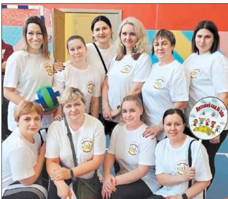
Команда детского сада № 366 заняла 2-е место в соревнованиях по дартсу в рамках окружной спартакиады, посвященной Году семьи, среди работников учреждений образования ЦАО г. Омска.