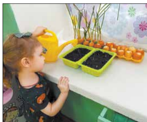
Тот самый «огород на подоконнике».

лектив возьмет за привычку сворачивать горы, а уж этот, пышущий неиссякаемой энергией, и подавно.