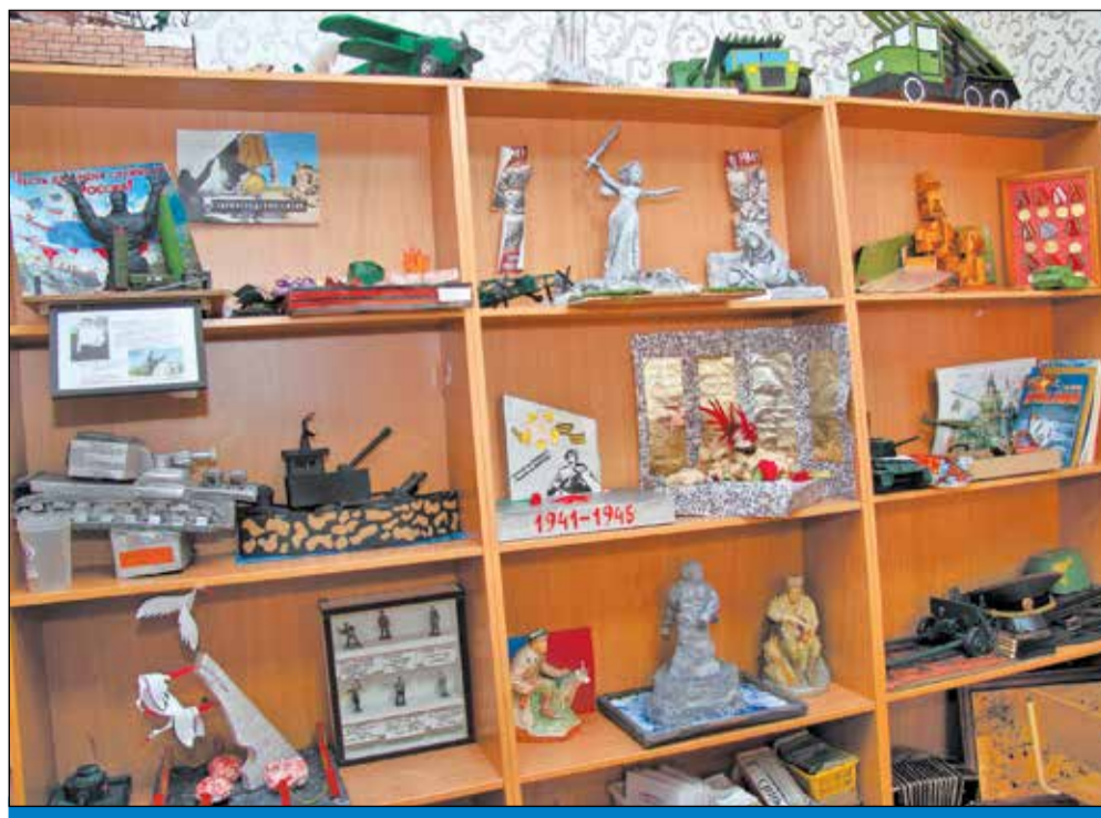
У детского сада № 366 есть даже свой музей боевой славы.

Среди множества событий, организуемых удивительным сообществом специалистов детского сада № 366, можно назвать, например, фестиваль семейного творчества. Семьи готовят к этому смотру разножанровые номера, рассказывают о своих традициях. Вообще говоря, это ревью, посвященное талантам, в том числе кулинарным, - так что здесь есть чему подивиться. Разумеется, на фести-