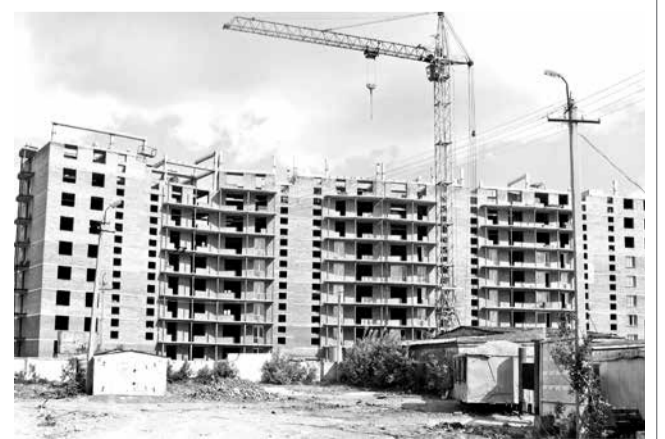
Лев ГРАЧЁВ.