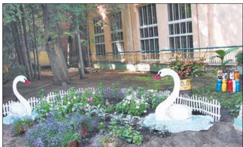
Школьники участвуют в благоустройстве территории предприятия.