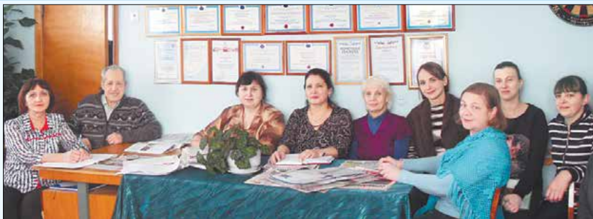
Профсоюзный актив АО «Сибирские приборы и системы».

Профсоюзный актив АО «Сибирские приборы и системы» убежден, что в области охраны труда и безопасности работников на производстве нет мелочей, будь это обеспечение спецодеждой, инструктаж, обучение уполномоченных и профактива или наличие медицинских аптек в подразделениях предприятия. Если созданы достойные условия труда, появляется атмосфера уверенности и эмоционального комфорта, а это очень важная составляющая любого трудового коллектива.