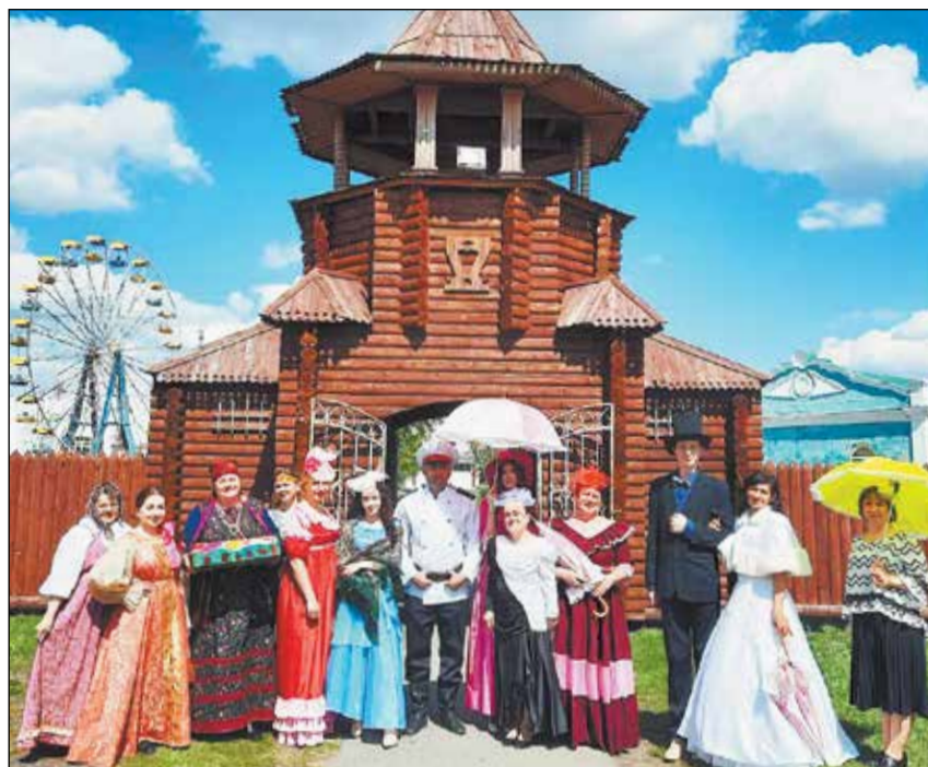
Фестиваль «Играем Чехова».

Сюда были приглашены творческие коллективы из одиннадцати районов региона, а также из Новосибирской и Тюменской областей. Праздник проходил одновременно на множестве площадок, и радостно изумленные тюкалинцы с утра до вечера переходили туда-сюда, пересказывая друг другу подробности увиденного. Между прочим, пересказывают до сих пор - таким ярким и незабываемым стал фестиваль.