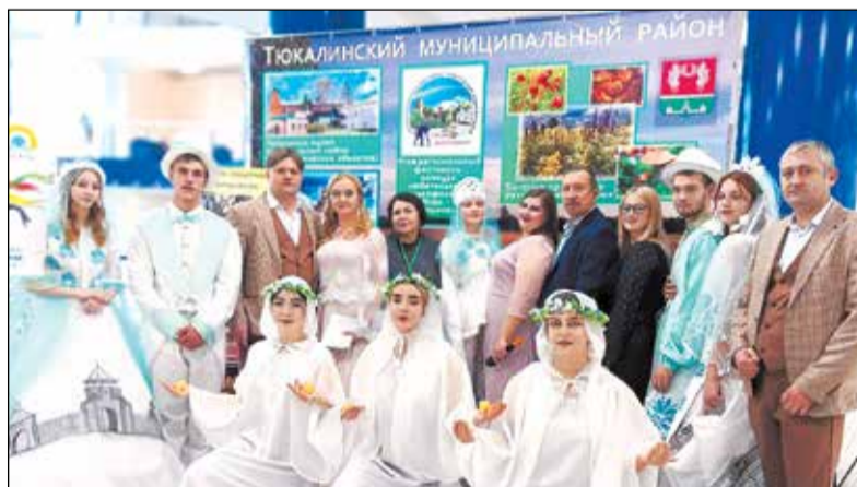
Тюкалинцы на ИННОСИБе.

Ещё одна значимая страница в истории тюкалинской культуры -