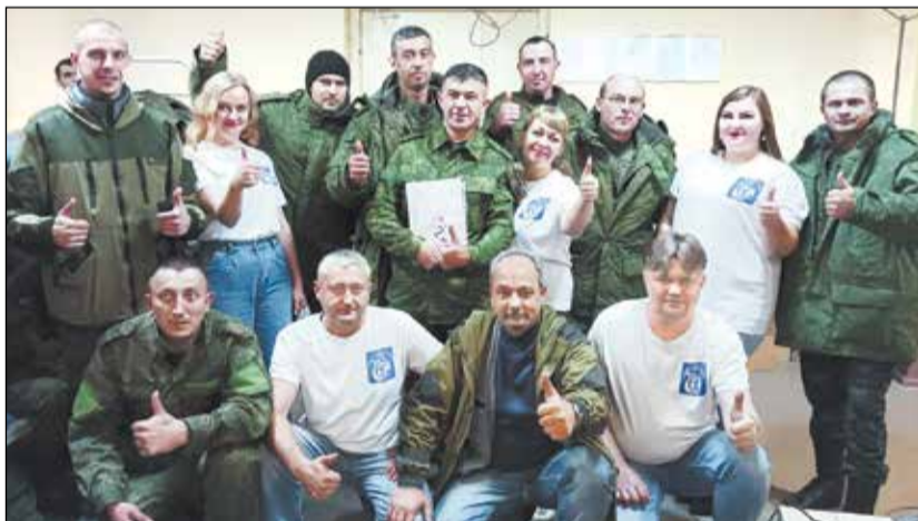
«Мелодия-Т» с концертом в Черемушках.