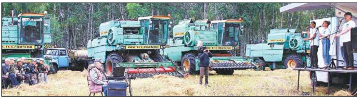
Выступление на полевом стане.