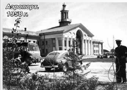
Аэропорт. 1958 г.