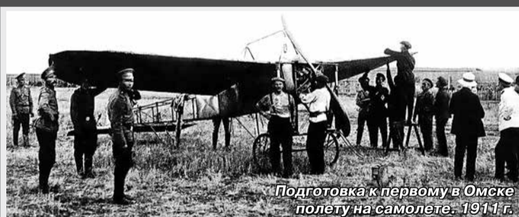
Подготовка к первому в Омске полету на самолете. 1911 г.