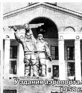
Уздания аэропорта. 1958 г.