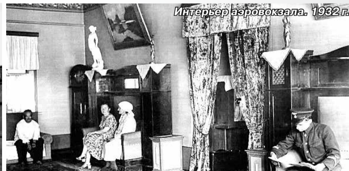
Интерьер аэровокзала. 1932 г.