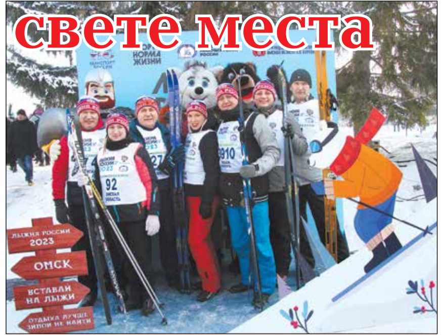
Команда Федерации омских профсоюзов.