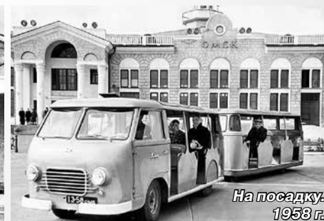
На посадку. 1958 г.