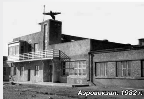
Аэровокзал. 1932 г.