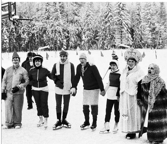
Пионерлагерь «Юность» московского завода «ЭРА». 1986 год.

Никому не нравилось то обстоятельство, что пионерлагеря работают всего три месяца в году, а всё остальное время простаивают, требуя тем не менее надлежащего ухода. И предприятия, владевшие лагерями, стали потихоньку завозить туда в зимнее время своих работников - для «активного отдыха». Довольны были все: трудящиеся понятно почему, а руководители вдруг получили возможность значительно улучшить отчетность в сфере «физкультурно-оздоровительной работы». ВЦСПС эту практику узаконил.