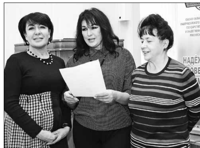
Со своим поэтическим творчеством знакомят представители первички Омской академии МВД.

Награждение победителей и участников состоялось в актовом зале Дома союзов. Впрочем, это была не просто торжественная церемония, но еще и душевный концерт, проходивший в теплой, дружеской обстановке. Здесь собрались представители первичек не только многих городских учреждений, но и расположенных в районах области. Итак, подведены были итоги областного конкурса в четырех номинациях - на лучшие агитационно-пропагандистский листок, видеоролик, стихотворение и песню, посвященные профсоюзной тематике. И надо сказать, что в этих разных ипостасях участники не только смогли раскрыть свои творческие способности, но и показать всю значимость и разноплановость деятельности профактива. Всего на конкурс было представлено 44 работы.