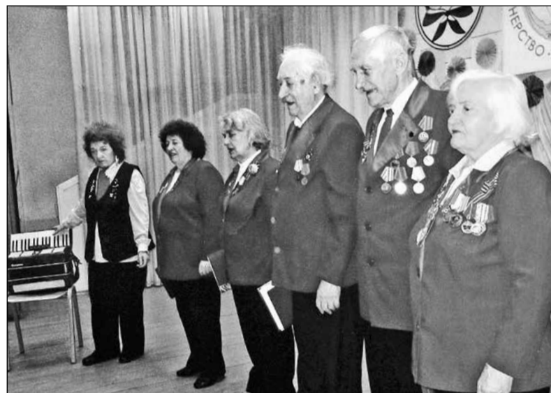
Выступает ансамбль «Стелла».