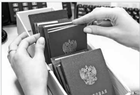
вая книжка выдается работнику не позднее дня увольнения.

Работнику, подавшему письменное заявление о предоставлении ему работодателем сведений о трудовой деятельности, работодатель выдает трудовую книжку на руки не позднее трех рабочих дней со дня подачи такого заявления и освобождается от ответственности за ее ведение и хранение. В случае если указанное заявление подано работником менее чем за три рабочих дня до его увольнения, трудо-