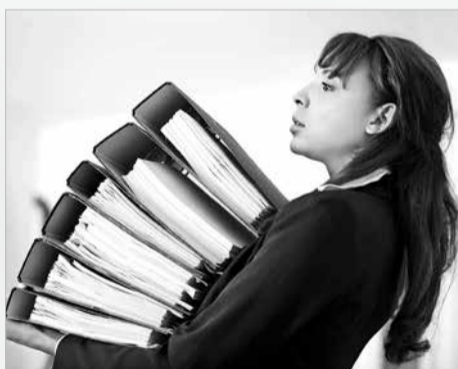
увеличения объема работ за дополнительную плату (ч. 1 ст. 60.2 ТК РФ).

Кроме того, работнику с его письменного согласия может быть поручено выполнение дополнительной работы по другой или такой же профессии (должности) путем