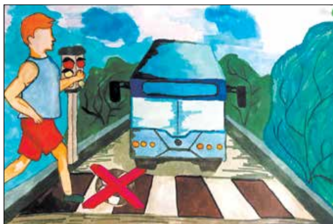
Анастасия Демченко, 13 лет.