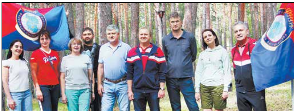
Члены оргкомитета спортивно-туристского многоборья.

Фантазии молодежи из ОАО «Сатурн» хватило аж на несколько эпох. Команда показала, как проходили турслеты при первобытном строе, в средние века, а затем - как организованы виртуальные межгалактические туристские испытания прямо на рабочем месте. Свою версию цифрового туризма продемонстрировала и команда АО «Омский НИИ приборостроения». Но все же ребята пришли к выводу, что, как бы далеко ни шагнул прогресс, главными атрибутами походной обстановки остаются командный дух, дружба, взаимовыручка. «Долой цифровой! Даешь на-