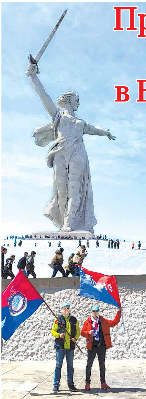
Фото участников автопробега.