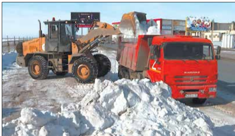
В противопожарных мероприятиях в этом году будут задействованы 154 единицы спецтехники УДХБ.

- С наступлением весны традиционно одним из наиболее актуальных вопросов становится проведение противопожарных мероприятий. Какова готовность к ним вашего предприятия?