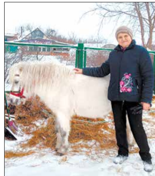
Фото участников выезда в «Политотдел».