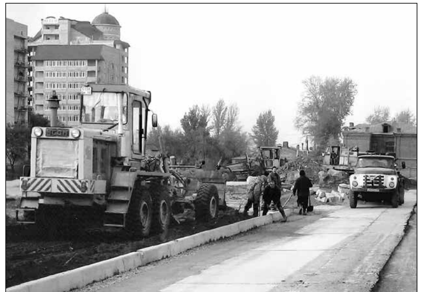
Дорожную отрасль ждут перемены.

В 2021 году на профсоюзном обслуживании в Омской областной организации Общероссийского профсоюза работников автомобильного транспорта и дорожного хозяйства состояло 36 первичных профсоюзных организаций - 31 в дорожной отрасли, три - на автотранспорте и два - на прочих предприятиях.