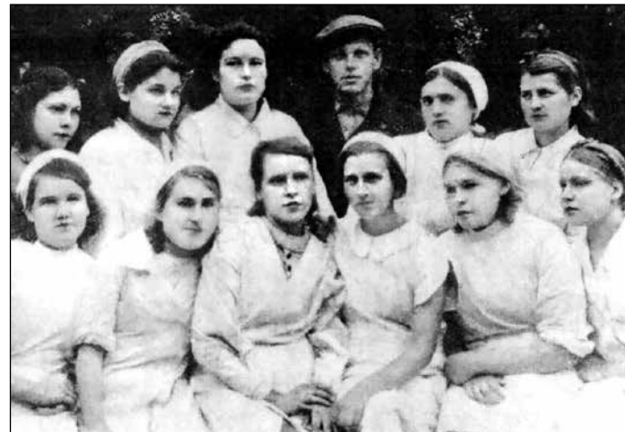
Работницы предприятия в Омском военном госпитале.

Но шефство не сводилось только к материальной помощи. Проводились встречи стариковцев завода с ранеными фронтовиками, беседы о текущем положении, выступала в госпитале заводская художественная самодеятельность. Да и это было не главным. Главное, что с вышитым кисетом и разноцветным мунд-