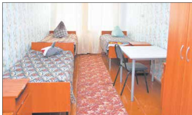
В общежитии техникума.

Однако жизнь диктует нам свои условия и свои тренды. И в 2008 году техникум стал развивать новое, очень важное в социальном смысле направление - обучение детей с ограниченными возможностями здоровья. Этот контингент съезжается сюда со всей области, что лишний раз подчеркивает актуальность избранного техникумом вектора. Таких воспитанников на данный момент 84 человека, и - примечательная деталь - практически всех их педагоги доводят до окончания обучения. Показатель, согласитесь, еще раз очень наглядно показывающий квалификацию воспитателей и мастеров, обучающихся детей по профессиям швеи, слесаря по ремонту сельскохозяйственных машин, а также маляра и штукатур-облицовочника-плиточника. Добавим, что во время обучения дети успешно участвуют в конкурсах профессионального мастерства. Да и возможностей для дальнейшего трудоустройства хватает - профессии, полученные ими в техникуме, достаточно востребованы.