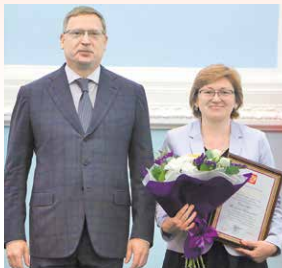
Александр Бурков вручил Татьяне Смирновой Благодарность Президента РФ, 2019 г.

высшего профессионального образования РФ», Благодарностью Президента РФ, имеет звание «Заслуженный работник высшей школы Российской Федерации».