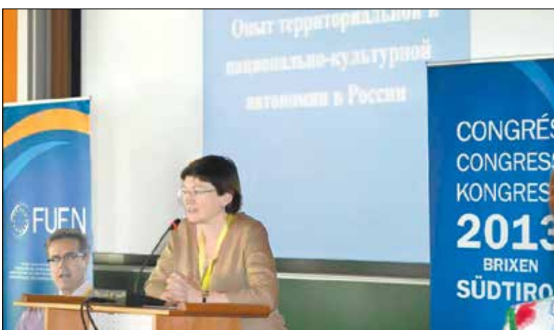
Выступление на конгрессе Федералистского союза европейских национальных меньшинств (FUEN). Бриксен, Южный Тироль, Италия, 2013 г.