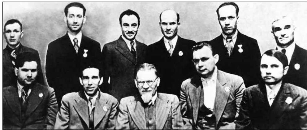
Михаил Иванович Калинин (в центре нижнего ряда) среди группы работников завода, награжденных за производство миноискателей.

Становление завода в Сибири проходило в исключительно трудных условиях военного времени. Оборудование было размещено