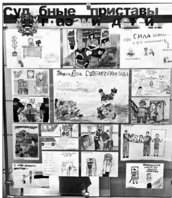
Работы, присланные на конкурс детских рисунков к профессиональному празднику.

Следующая наша зона ответственности - организация дознания. Мы возбуждаем и расследуем уголовные дела за уклонение от исполнения судебных решений, от уплаты задолженностей и так далее. Наконец, в наши обязанности вменена защита граждан от неправомерных действий коллекторских агентств. Отметим при этом, что чисто омских подобных организаций всего две, и они проблем не создают. А вот филиалы и представительства ино-