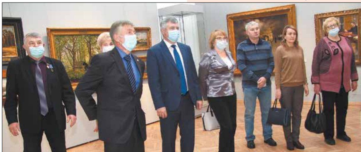
Экскурсия для профсоюзных лидеров.

Подчеркивая важность деятельности профсоюзных организаций России, президент В. В. Путин сказал: «Задачи у государственной власти любого уровня и у профсоюзов любого уровня одни и те же - это социальное благополучие граждан России». Непрерывная связь поколений и сохранение лучших традиций работы, сохранение верности профсоюзу дает всем нам уверенность в завтрашнем дне и веру в справедливость!