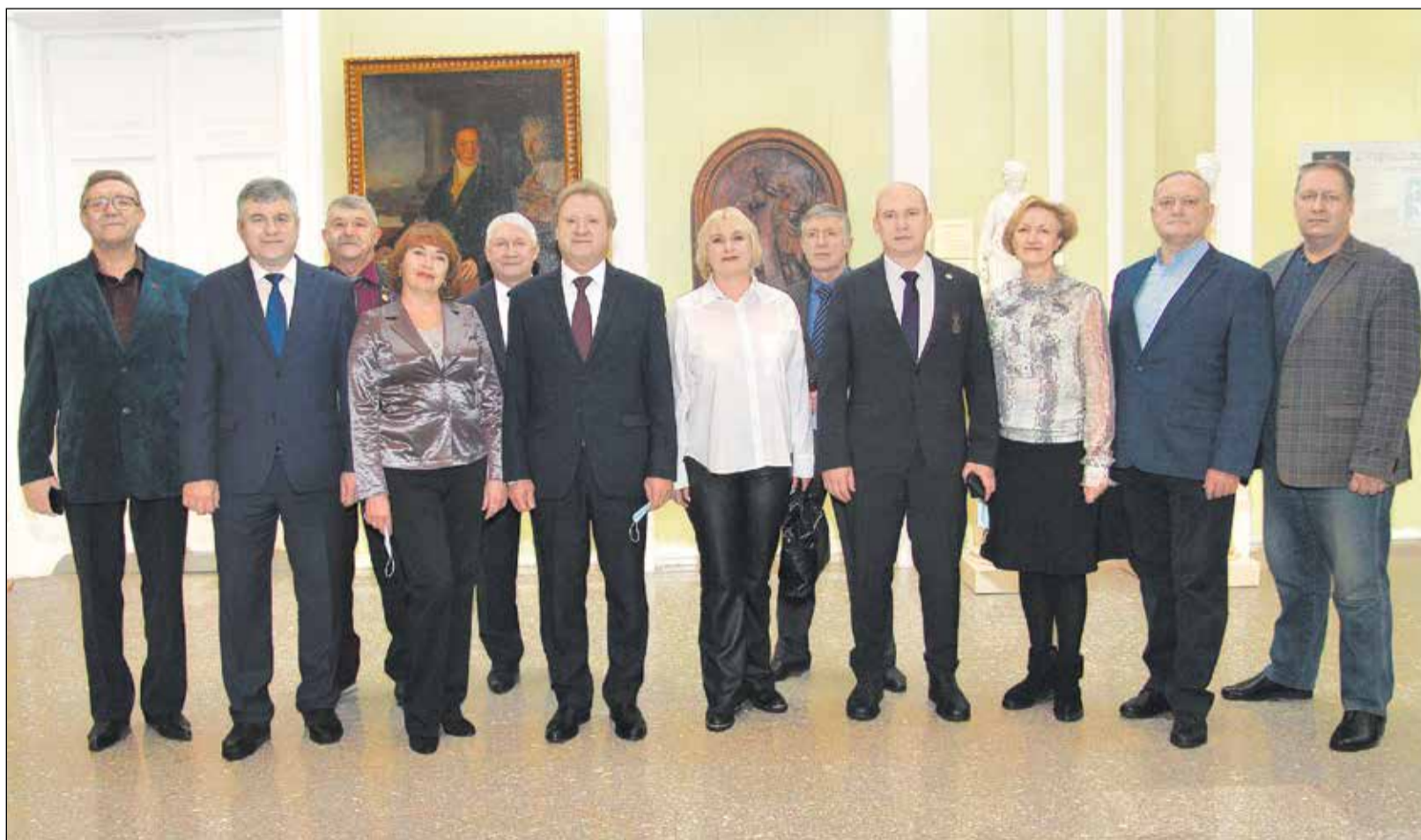
Профактив Омской области.

1 ноября, в День профсоюзов в Омской области, в Музее изобразительных искусств имени М. А. Врубеля состоялось торжественное собрание профсоюзного актива региона