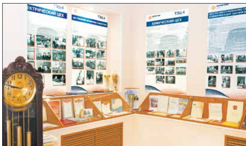
Исторические материалы комнаты трудовой славы СП «ТЭЦ-4».