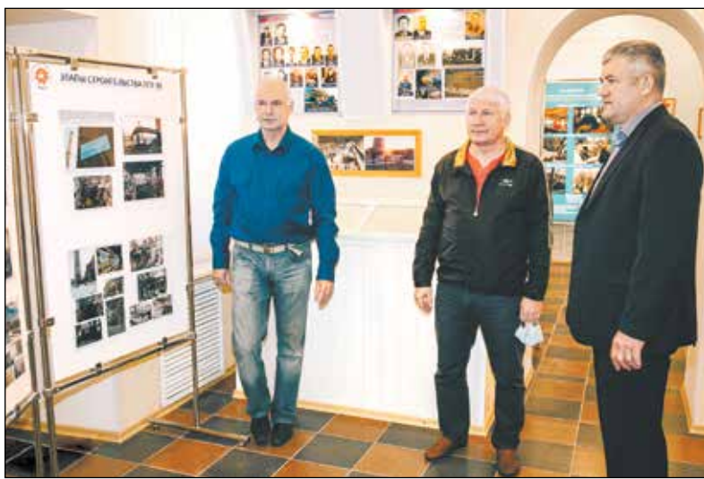
Посещение комиссией ОмскОО ВЭП музея трудовой славы СП «ТЭЦ-3».

«Мы делаем первые шаги в большой, взрослой жизни. И наша станция делала первые шаги в экс-