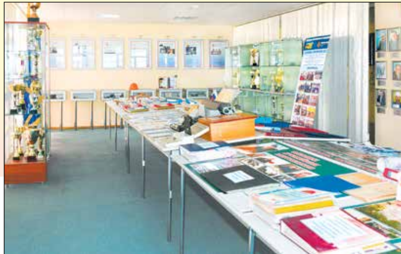
Экспонаты комнаты славы СП «ТЭЦ-5», посвященные истории становления.

В музее трудовой славы СП «ТЭЦ-2» комиссию встречали председатель совета ветеранов АО