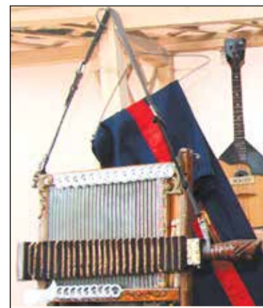
Та самая бряшма.

Проверил на себе. Вроде дрогнуло. Так, может быть, в каждом