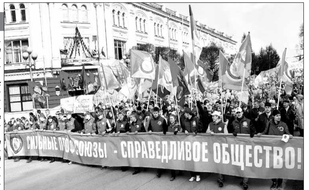
Первомайское шествие в Омске. 2017 г.