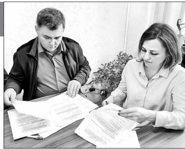
Члены счетной комиссии за работой.