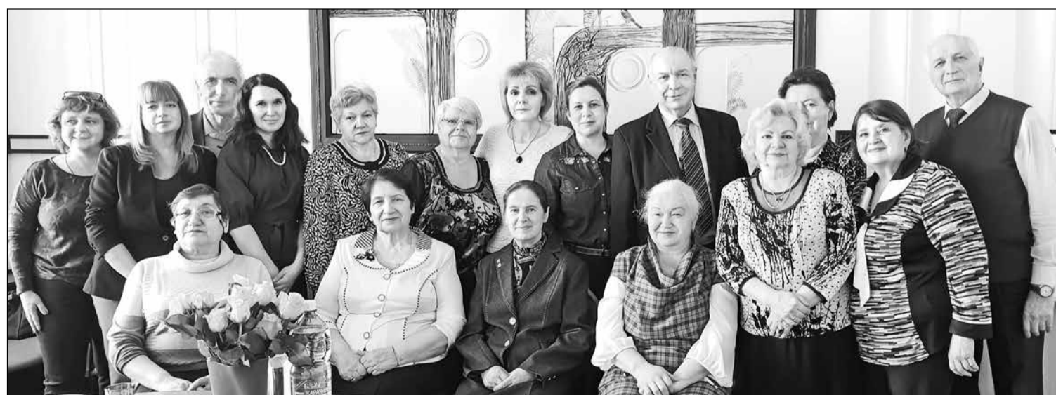
Профактив работников СибАДИ.

В условиях массовой цифровизации всех сфер нашей жизни профсоюз внедряет новые формы и методы работы внутри организации. Для оперативного взаимодействия и повышения эффективности информационной работы созданы группы в соцсетях и мессенджерах. На сайте организации есть раздел, где регулярно представляются видеотчеты о деятельности ППО СибАДИ. Для повышения грамотности и вовлечения новых членов в профсоюз в университете в 2019 - 2020 годах было организовано обучение профактива и всех желающих членов профсоюза по программам центра профсоюзного обучения Федерации омских профсоюзов.