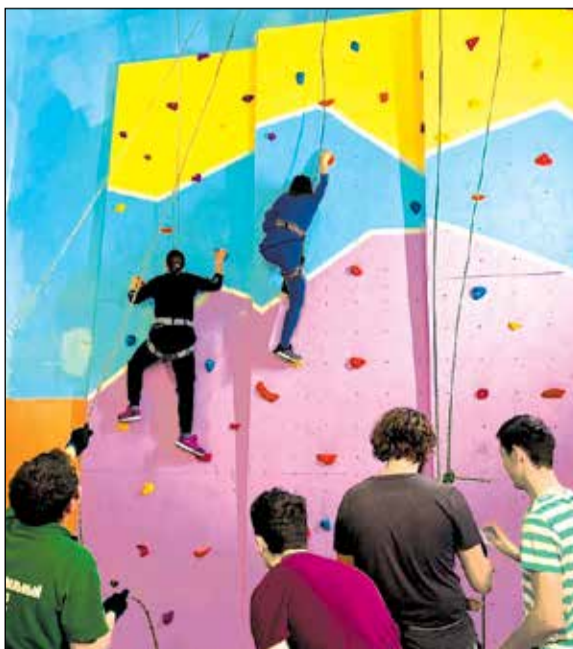
Теперь студенты ОмГПУ могут тренировать выносливость на скалодроме, который был оборудован на средства гранта, выигранного в этом учебном году.