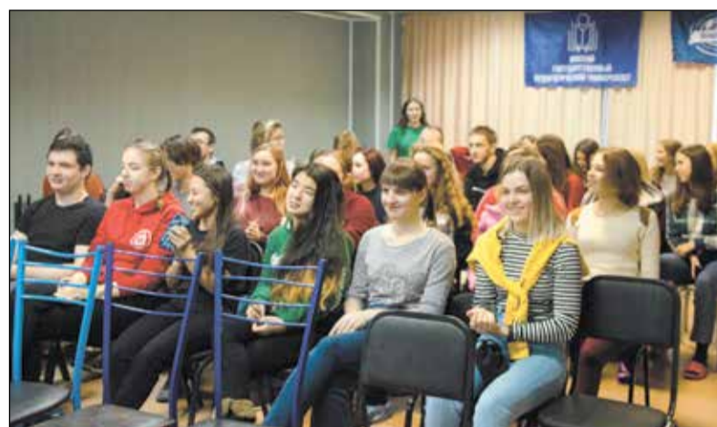
Выездная школа профоргов.

лоне здесь рассматривается только как дополнительное преимущество претендентов на приглашение. Прежде всего - достижения в учебе, спорте, творчестве, общественной деятельности. И нередко случается, что значительную часть «бомонда» на этом светском мероприятии составляют представители студенческого профактива. Не так уж и удивительно, если учесть, что профком всегда находится в эпицентре вузовской жизни, «правит бал» во многих ее сферах.