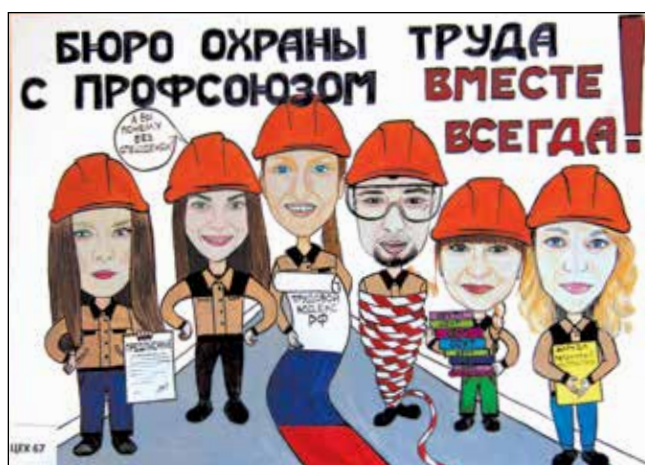
Плакат коллектива цеха № 67 - один из победителей профсоюзного конкурса.

Лев ГРАЧЁВ.