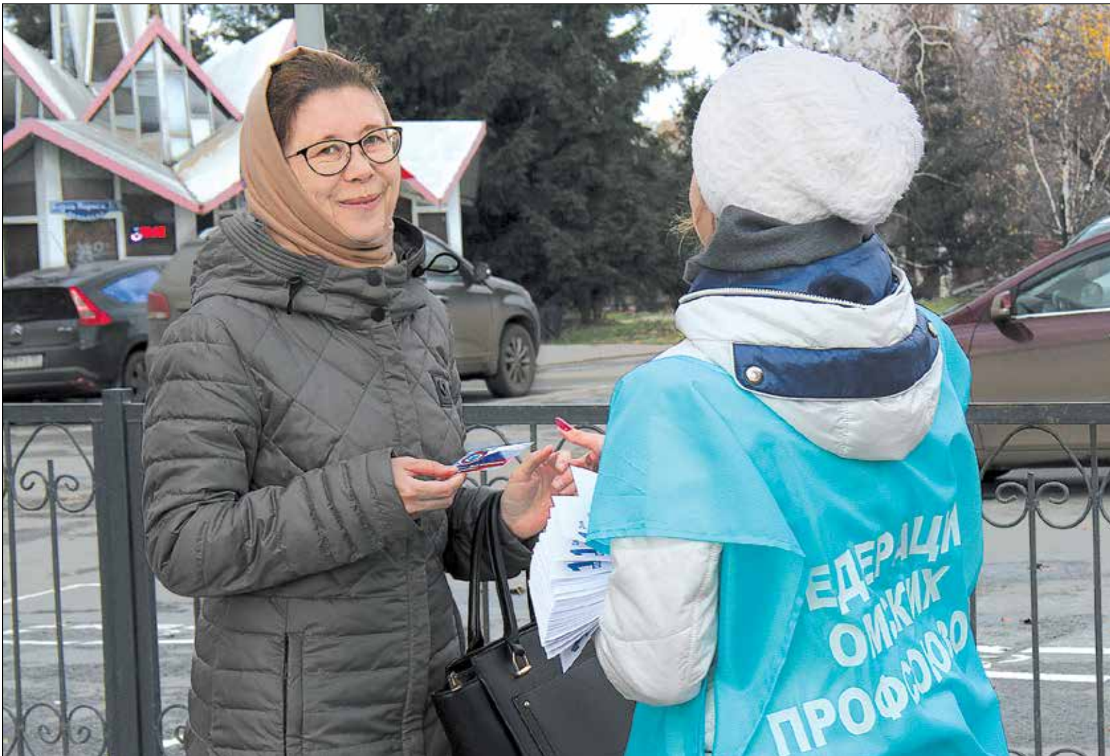
В День профсоюзов волонтеры раздавали омичам информационные листовки «Что такое профсоюз».

День профсоюзов, впервые прошедший в Омской области, стал не просто «праздником одного дня» - он дал немало поводов и для углубленной разработки в дальнейшем уже апробированных направлений развития профсоюзного движения в регионе, и для поиска новых возможностей укрепления авторитета общественной организации, которая по-прежнему остается для трудящихся надежным защитником их интересов.