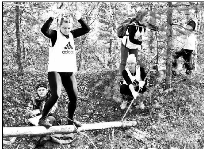
Преодоление преград на туристском слете 2019 г.

Проведение корпоративных мероприятий - хороший способ нематериального стимулирования работников и мотивации профчленства, считают в профсоюзной организации работников детского сада «Сибирский»