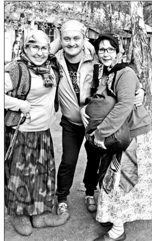
Профсоюзные активисты перед премьерой спектакля.

Сегодня в рядах первичной профсоюзной организации трудового коллектива детского сада «Сибирский», что в поселке Ростовка Омского района, - 51 человек (это 78 процентов от числа сотрудников детского сада), и каждого профком старается вовлечь в свою кипучую и интересную жизнь. К примеру, традиционным уже стало участие в районном туристском слете работников образования. Причем это дошкольное учреждение оказалось одним из первых среди детских садов пригорода, присоединившихся к дружной команде турслетовцев.