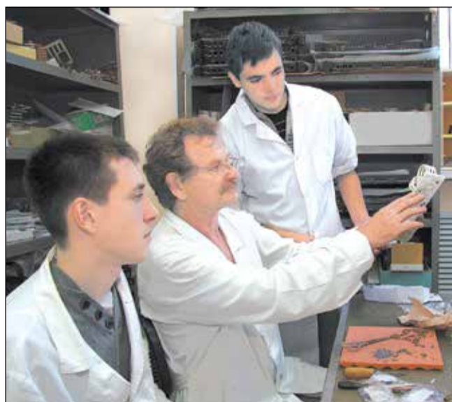
Уже давно АО «ОНИИП» реализует программу «Трудовое лето» - ежегодно школьники проходят практику на предприятии.

тий со студенчеством тоже налажена недостаточно эффективно. Далеко не все работодатели ее поддерживают, к тому же в совместной деятельности с учебными заведениями зачастую преимущество отдается теории, а не практике. Если говорить о положительных примерах в плане построения сотрудничества с учреждениями образования, то здесь можно выделить Омский НИИ приборостроения и ряд предприятий нефтехимии.