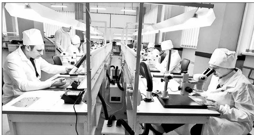
Так сегодня выглядят производственные цеха предприятия.