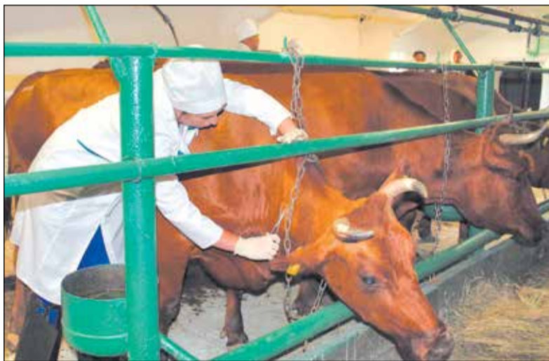
Участники областного конкурса профмастерства ветеринарных работников демонстрируют опыт и знания как в теории, так и на практике.

- Бессмысленно вкладывать средства в дорогостоящее оборудование, если нет квалифицированных сотрудников, которые будут на нем работать, - продолжает руководитель. - Региональные органы власти это понимают - наше ведомство финансируется из областного бюджета. Нам идут навстречу в вопросах оплаты труда. Еще три года назад средний уровень зарплат в ветеринарной службе составлял около 15 тысяч рублей, в 2017 году он увеличился до 18,5 тысячи рублей, а по итогам