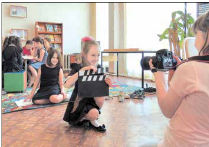
Уроки в рамках проекта «Мир в объективе» позволили направить чрезмерную любовь молодого поколения к гаджетам в позитивное русло.

бабушкиного сундука», поддержанный благотворительным фондом Елены и Геннадия Тимченко. В селе Путинцево специалисты КЦСОН с помощью волонтеров из местной школы организовали 12 мастер-классов, обучающих шить игрушки по популярной технике, и 55 практических занятий. За пять месяцев пенсионерки, участвующие в проекте, освоили современные швейные машины, научились кроить и декорировать. А сколько значила для них возможность уйти с головой в творческий процесс, общаться с «коллегам по цеху», отвлечься от телевизора, забыть о недугах. Не стоит сбрасывать со счетов и практическую пользу - кукла Тильда нынче в моде и неплохо продается, что дает шанс заработать прибавку к пенсии. Ну а первые сто игрушек, изготовлен-