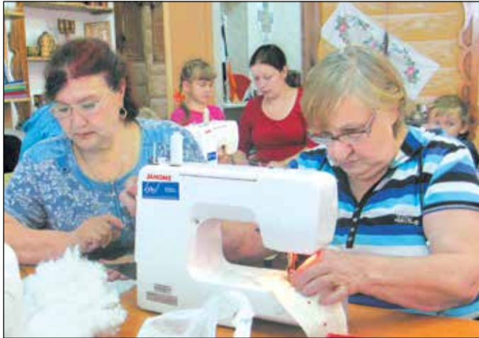
Мастер-классы, обучающие популярным швейным технологиям, помогли пенсионеркам забыть о недугах и окунуться в творческую атмосферу.

ные в рамках проекта, были подарены сельским ребятишкам из малообеспеченных семей.