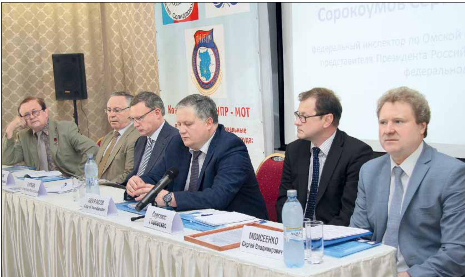
Омск, 2018 г. Пленарное заседание Международной конференции ФНПР - МОТ «Международные и национальные правовые нормы в сфере оплаты труда: практика применения».

Сегодня, 27 июня, в Южно-Сахалинске началась двухдневная научно-практическая конференция «Достойная занятость, международные и национальные трудовые нормы для обеспечения лучшего будущего сферы труда», которую проводят Международная организация труда, Федерация независимых профсоюзов России, Ассоциация территориальных профобъединений Дальневосточного федерального округа и Сахалинский областной союз организаций профсоюзов. Основная цель конференции - собрать на одной площадке профессионалов и экспертов сферы труда для обсуждения вопросов обеспечения достойной занятости, безопасных условий труда, роста уровня заработной платы.