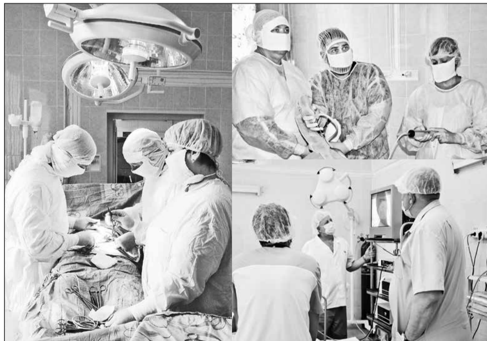
Администрация и профком Большереченской ЦРБ постоянно заботятся об улучшении условий труда: комфортная рабочая обстановка и качество оказываемой пациентам медпомощи взаимосвязаны, считают они.

Встреча за круглым столом прошла плодотворно. Состоялась в рамках выездного мероприятия и еще одна - на волейбольном поле. И она тоже, уверен председатель обкома, пойдет на пользу укреплению связей между городом и районом. Во время товарищеского матча по волейболу соревновались работники учреждений здравоохранения Омска и большереченские спортсмены. А дружную команду болельщиков составили сотрудники ЦРБ. Турнир в таком формате проводился впервые. В основном спортивные состязания проходят внутри одного коллектива, если речь, конечно, не о