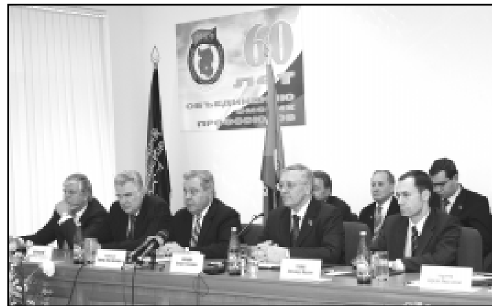
Торжественное заседание, посвященное 60-летию регионального профобъединения, 2008 г.