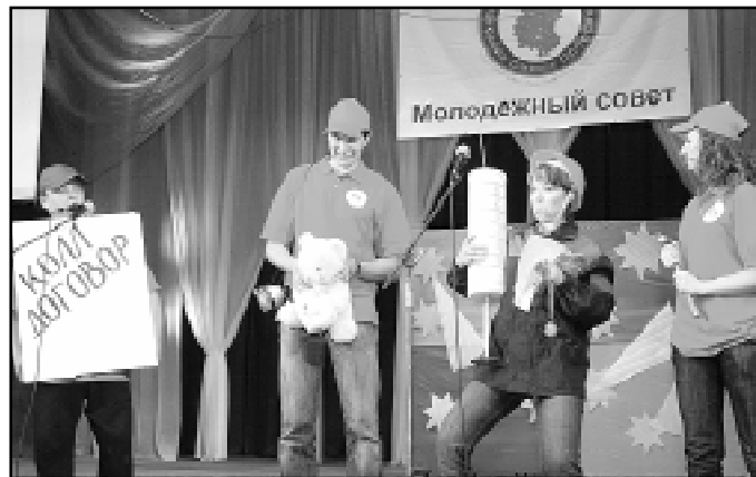
Конкурс агитбригад молодежных советов предприятий и организаций, 2007 г.