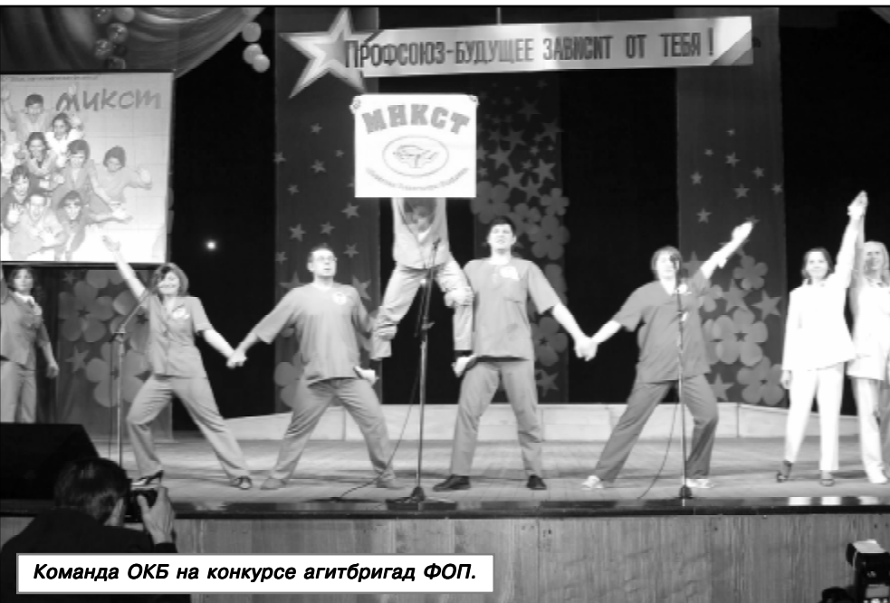
Команда ОКБ на конкурсе агитбригад ФОП.