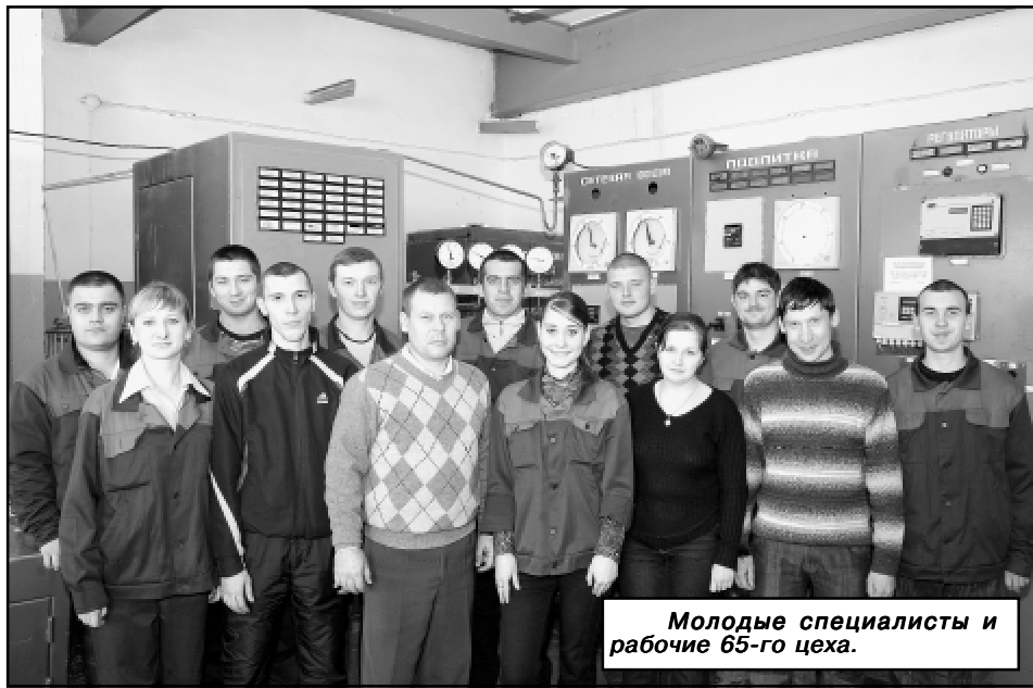
Молодые специалисты и рабочие 65-го цеха.