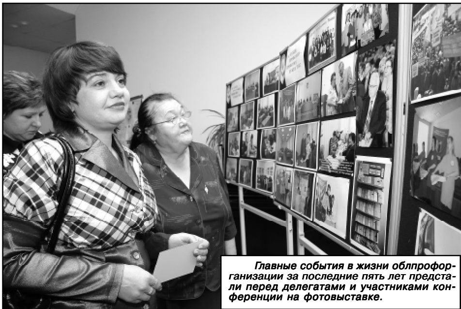
Главные события в жизни облпрофорганизации за последние пять лет представили перед делегатами и участниками конференции на фотовыставке.