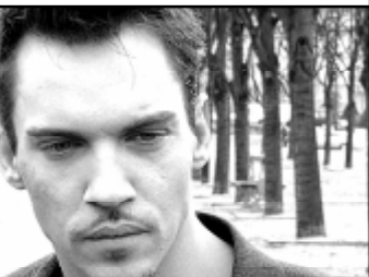
натан Риз-Майерс) приставляют к брутальному секретному агенту (Траволта): вместе они должны выполнить в Париже некую сверхсекретную миссию, о которой доподлинно известно лишь то, что она не связана с наркотиками.