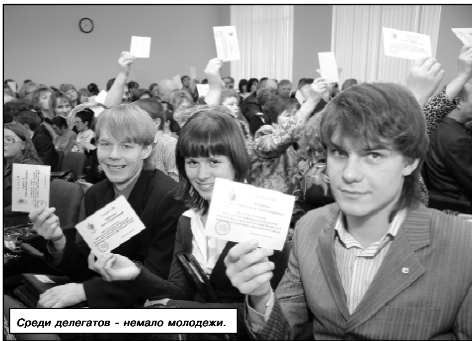
Среди делегатов - немало молодежи.

Говоря об итогах завершившихся отчетов и выборов, отмечу: они показали, что состав профсоюзных территориальных руководителей - это в большинстве профес-