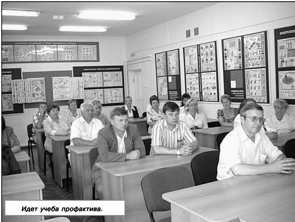
Идет учеба профактива.

Наказов на отчетно-выборной конференции профсоюзной организации "Омского бекона" прозвучало тоже немало, в том числе объединенному профкому. Однако по всему видно, настроен его новый состав на работу с полной отдачей. Действовать, преодолевая ставшую уже притчей во языцех закрытость хозяев компании, он намерен так, чтобы ни у кого не вызвала сомнений известная фраза: о светлом будущем заботятся политики, о светлом прошлом - историки, о светлом настоящем - профсоюзы.