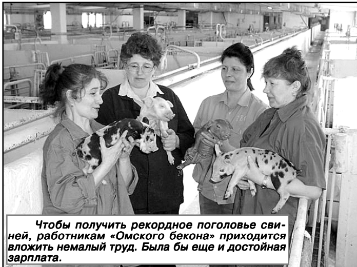
Чтобы получить рекордное поголовье свиней, работникам «Омского бекона» приходится вложить немалый труд. Была бы еще и достойная зарплата.

Однако в своих выступлениях они подчеркивали: да, сделано немало, но по целому ряду проблем сдвиг пока не видно: в частности, несмотря на то, что коллектив "Омского бекона" считает профорганизацию своим вожаком, за последние пять лет не удалось переломить ситуацию с падением ее численности. И главная причина здесь - сокращение работников на предприятиях.