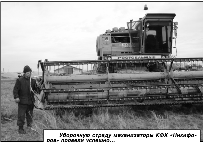
Уборочную страду механизаторы КФХ «Никифоров» провели успешно...