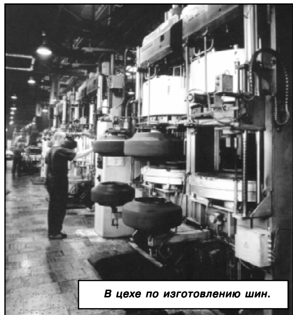
В цехе по изготовлению шин.