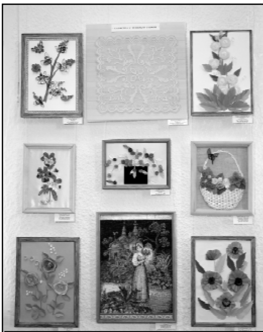
На выставке творческих работ педагогов представлены произведения самых разных видов декоративно-прикладного искусства.

Елена ГЕНЕРАЛОВА.