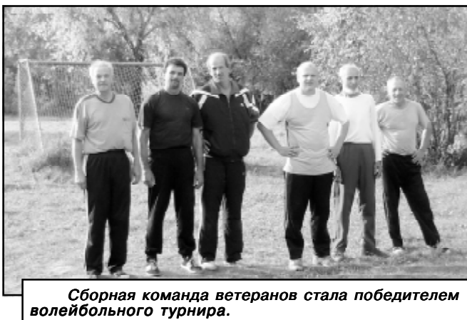
Сборная команда ветеранов стала победителем волейбольного турнира.

Всем победителям и призерам спартакиады вручены награды. Помимо этого в качестве поощрения профком планирует всех участников вывезти в конце октября на выходные дни в один из загородных лагерей. А в следующем году, как сообщила Надежда Кучук, должна состояться спартакиада в честь 65-летия Великой Победы. Призовой фонд будет увеличен, благо администрация ОМКБ ежемесячно перечисляет профкому 0,3 процента от фонда оплаты труда на культурно-массовую и спортивную работу. Кстати, часть этих средств идет на аренду спортзала в строи-