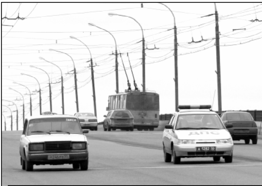
Члены созданной профорганизации считают, что Госавтоинспекция должна предъявлять к таксистам те же требования, что и к общественному транспорту.

В городе в настоящее время, по подсчетам С. Воткина и его товарищей, работает свыше 10 тысяч таксистов. Сложившейся обстановкой возмущено большинство из них. Часть недовольных стремится решать возникшие проблемы путем радикальных мер - с помощью акций протеста (таковые в Омске уже проходили, но к ощутимым результатам не привели). Требования таких водителей сводятся исключительно к повышению тарифов на проезд для населения. Но есть и другая, более прогрессивно настроенная, категория таксистов, всерьез обеспокоенных своим