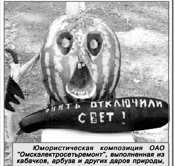
Юмористическая композиция ОАО "Омскэлектросетьремонт", выполненная из кабачков, арбуза и других даров природы, служит подтверждением тому, что полет человеческой фантазии не знает границ.