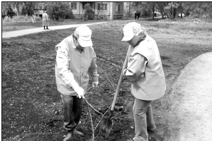
Финансирование организации общественных работ увеличилось примерно на 30 млн рублей.

Как нам сообщили в пресс-службе Главного управления государственной службы занятости населения Омской области, их ведомством был разработан пакет документов, предполагающий увеличение размера субсидии федерального бюджета бюджету Омской об-