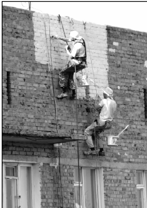
Ремонт "хрущевок" идет по графику.

природы также зашла речь на пресс-конференции. С 5 июля по 5 августа, по подсчетам специалистов, в Омске выпало пять норм осадков. И с ними по объективным причинам не справилась имеющаяся в городе водопропускная система. Ливневая канализация в Омске несколько последних десятилетий даже не проектировалась. Планы по прокладке нового коллектора рассматриваются, но проект этот очень затратный - 10 млрд рублей потребуются только на введение в эксплуатацию первой очереди. Продолжая жилищно-коммунальную тему, мэр сообщил журналистам о том, что уже скоро в Омске начнет реализовываться новая технология по сбору мусора, предложенная фирмой "Чистый город". Суть проекта в использовании специальных полиэтиленовых контейнеров-колодцев с люком и крышкой, две трети которых будет находиться под землей. В сентябре для таких контейнеров намечено подготовить первые площадки, всего же, при полной реализации проекта, их планируется оборудовать около шестисот. Плюсы данной технологии - улучшение внешнего вида территории, отсутствие неприятных запахов, снижение зат-