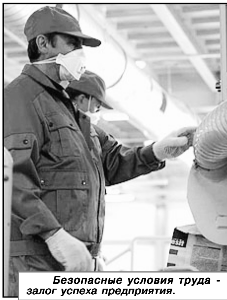
Безопасные условия труда - залог успеха предприятия.