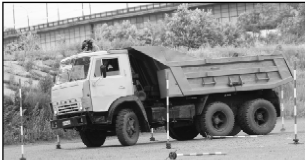
Участники состязаний водителей грузовых автомобилей удивили легкостью управления тяжелой техникой.