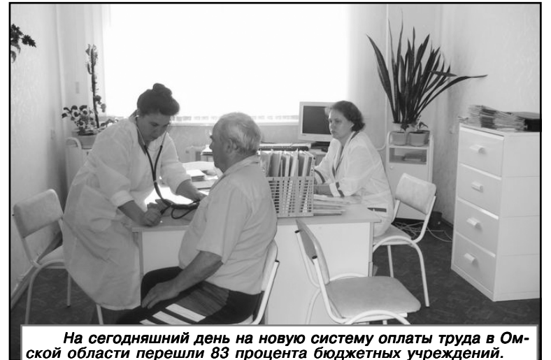
На сегодняшний день на новую систему оплаты труда в Омской области перешли 83 процента бюджетных учреждений.