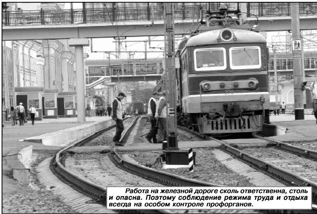
Работа на железной дороге сколь ответственна, столь и опасна. Поэтому соблюдение режима труда и отдыха всегда на особом контроле профорганов.