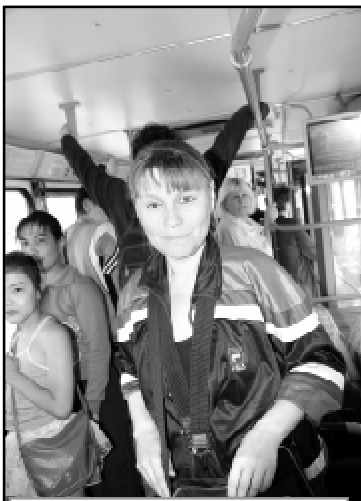
Работа у кондукторов не только нервная, но и травмоопасная.

Но не всегда в несчастных случаях виноват работодатель. Кондуктор МП г. Омска "Пассажирское предприятие № 8" получила тяжелую травму позвоночника, нарушив инструкцию, в которой определено, что во время движения автобуса кондуктор должен крепко держаться за поручни. Однако во время движения по маршруту работница за поручни не держалась,