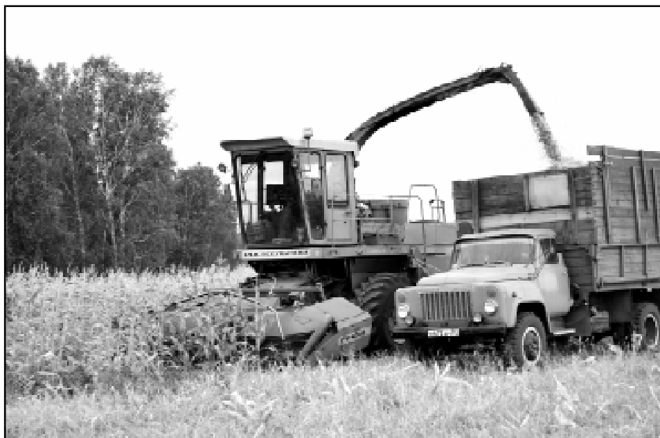
Уборку кукурузы успели закончить вовремя, до заморозков.

Раньше здесь было закрытое акционерное общество. Его руководитель допустил просроченность по зарплате более 7 миллионов рублей. А заодно "свернул" местную профорганизацию. Следом ушел колдоговор... Люди, привыкшие получать различные доплаты, материальную помощь и так далее, вдруг обнару-