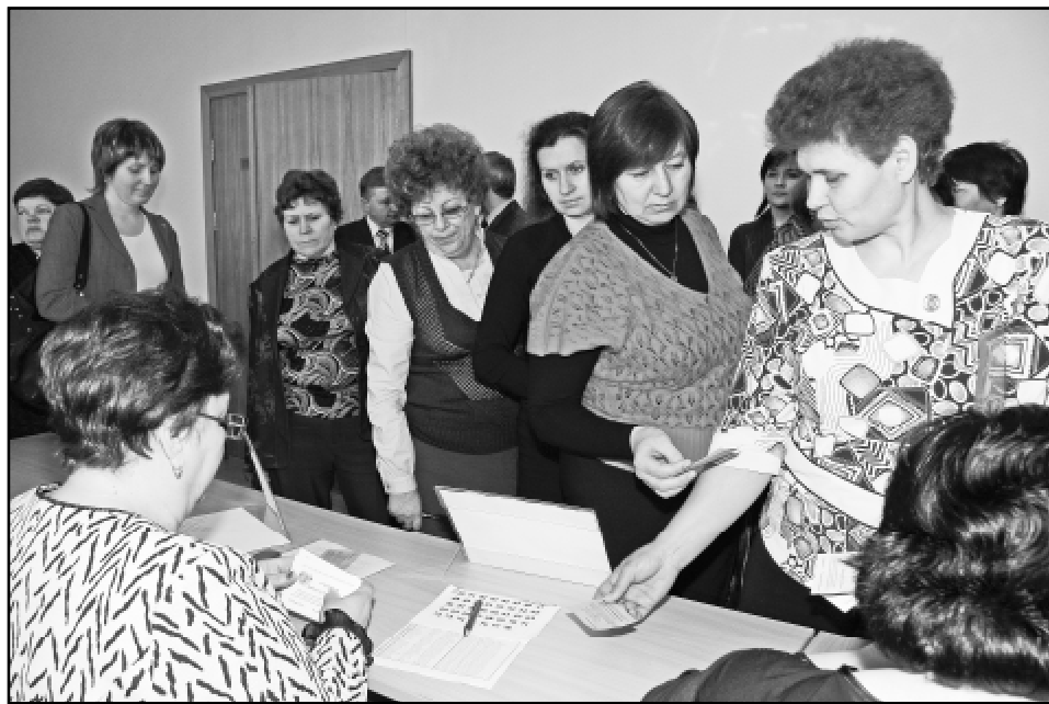
Идет регистрация делегатов конференции.

Кстати, о необходимости интенсификации обучения профсоюзного актива и кадров на конференции говорилось немало. Оно и понятно - веление времени. "Этого требует и то обстоятельство, что после проведения отчетов и выборов произошла опеределенная смена профактива. У нас на предприятии, например, в профсоюзном комитете стало больше молодежи", - отметила