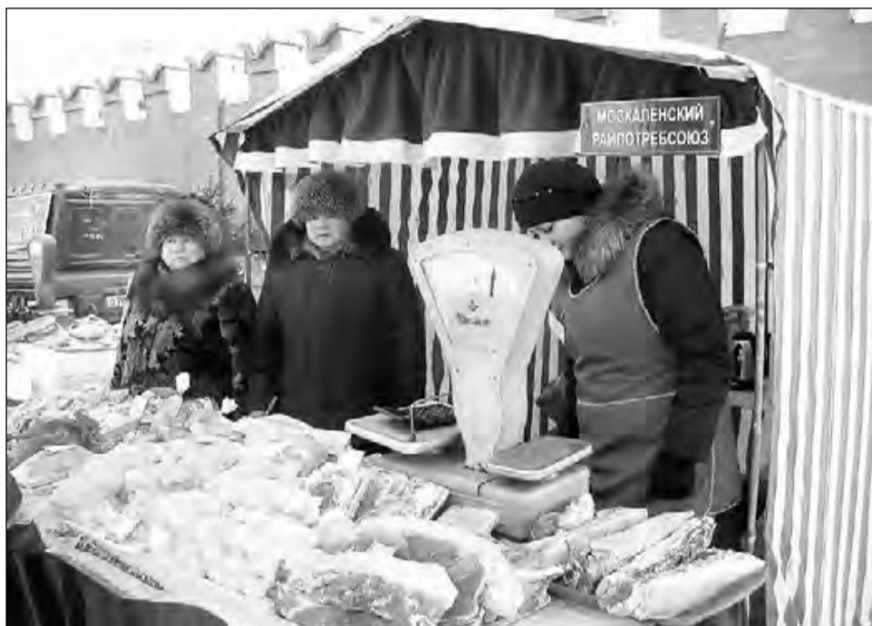
Работники Москаленского РСП на социальной ярмарке в Омске.

Профессионализм, ответственность, любовь к своей профессии всегда отличали работников москаленской потребительской кооперации и сегодня передаются от ветеранов новому поколению.