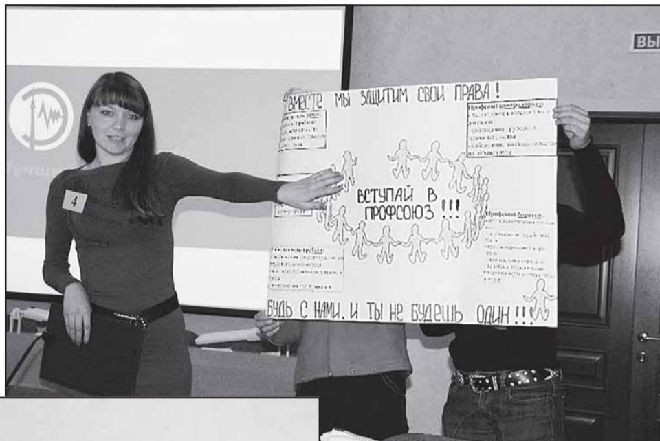
Презентация агитационных плакатов.

Понятно, их сменил серьезный настрой, когда дело дошло до докладов, подготовленных конкурсантками. Ведь рассматривались самые разные аспекты и проблемы - от улучшения информированности членов профсоюза до роли цеховой профсоюзной организации в отстаивании интересов и защите прав работ-