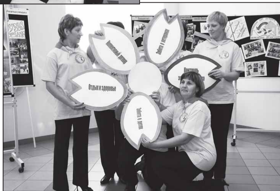
Все основные преимущества профчленства нашли отражение в эмблеме первички Новоомской школы Омского района.

Впрочем, поощрения заслужили все таланты - ни одна "изюминка" не осталась незамеченной. Успехи каждой команды были отмечены в специально учрежденных номинациях. Школа № 68 Ленинского округа получила награду за оригинальность жанра выступления, школа № 116 Центрального округа - за сценическую культуру исполнения. Черлакская районная организация профсоюза удостоена диплома за оригинальность идеи, Тюкалинская - за командный дух, Русско-Полянская - за волю