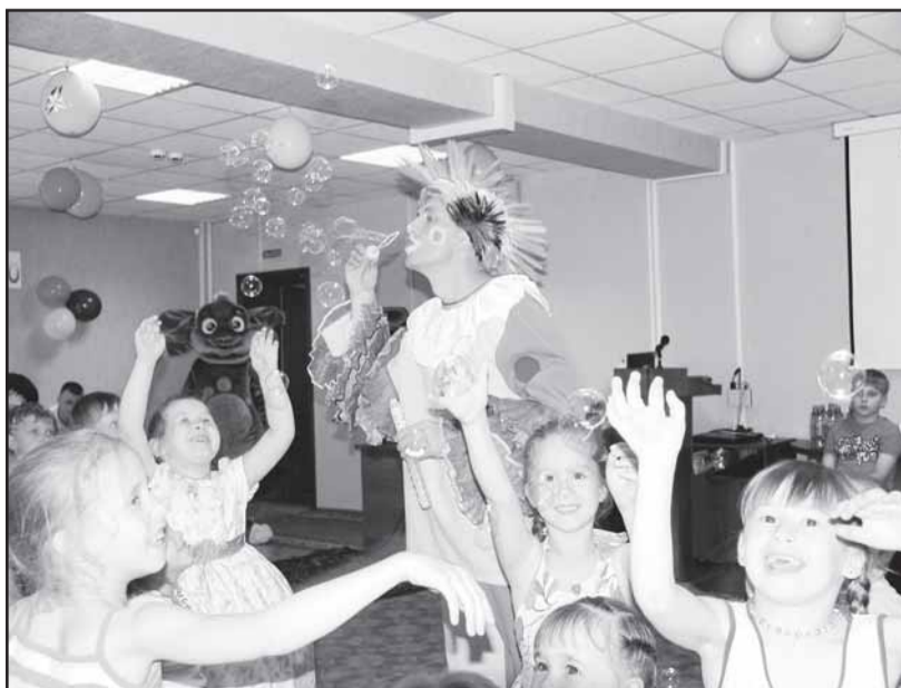
В День защиты детей.