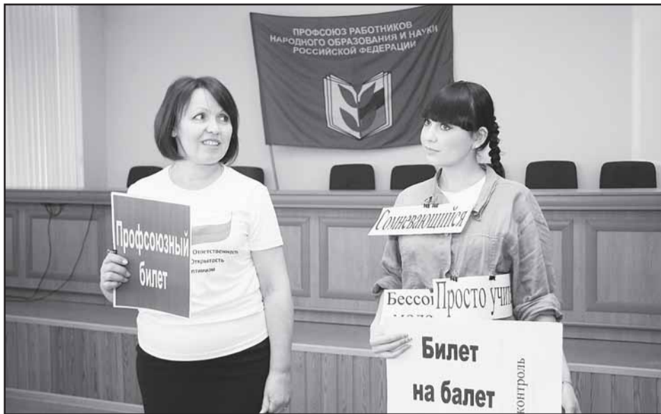
Самые убедительные доводы нашли педагоги школы № 145 Кировского округа.

"Как сделать так, чтобы нас стало больше?" - с такого вопроса всегда начинается традиционный конкурс агитбригад по мотивации профчленства, организуемый обкомом профсоюза работников народного образования и науки. В этот раз было дано десять остроумных, оригинальных и, главное, убедительных ответов. Именно столько команд приняло участие в состязаниях, состоявшихся на прошлой неделе. Конкурс под девизом "Защитит от разных бед профсоюзный твой билет" был посвящен Году первичной профорганизации, объявленному Центральным советом отраслевого профсоюза.