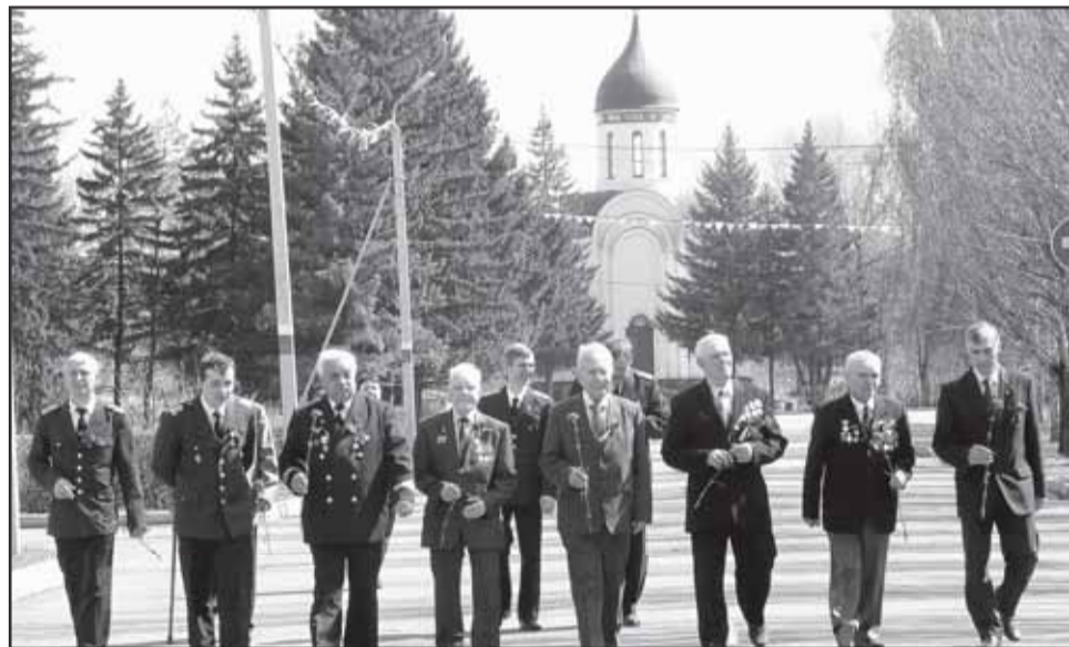
В Обь-Иртышводпути умеют чтить историю и традиции, поэтому ветераны всегда окружены вниманием.

профильных учебных заведений, занимается лишь на период навигации. Кто-то на следующий год приходит вновь, кто-то нет. Так или иначе, колдоговор с администрацией подписывает профорганизация, выступающая от имени большинства.