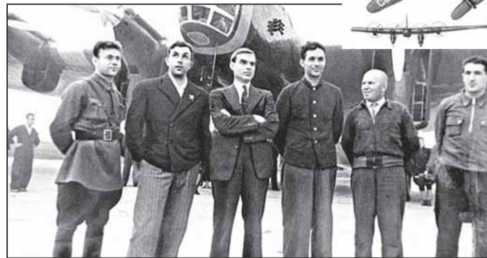
Сигизмунд Леваневский (третий слева) по духу был первопроходцем и небо любил до самозабвения. Словом, незаурядная личность. Но ему фатально не везло...

Арктические полеты в 30-е годы прошлого века, помимо отсутствия видимых ориентиров, осложнялись отсутствием навигационных устройств. Магнитные компасы в районе полю-